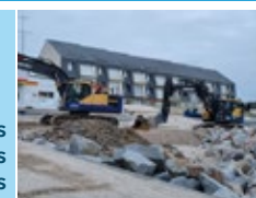
* Enrochement de Jullouville sud

le 2 novembre, des arbres à terre et des coupures d'électricité mais sans gros dommages, grâce à une tempête en petit coefficient et en dehors de la marée haute, des digues surveillées, un lit du Thar entretenu (mais durablement haut cet hiver) et les vis d'évacuation aux Huguenants efficaces. Restons vigilants, entretenons les infrastructures, nos maisons et jardins, surveillons le Thar comme le lait sur le feu !