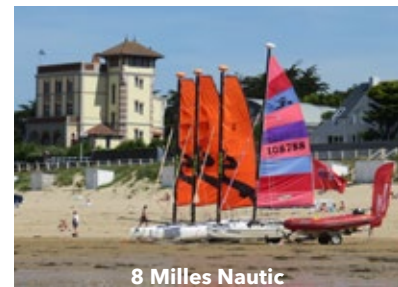
8 Milles Nautic

ÉTÉ 2024 Ouverture 8 semaines 593 stages vendus Moniteurs 2 Brevets d'État + 10 moniteurs CQP + 1 agent d'accueil Chiffre d'affaire : 114 648 € Taux de remplissage : -juillet 92 % -août 84 % Chiffre d'affaire toutes activités 2024 159 000 € HT