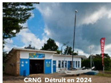
CRNG Détruit en 2024