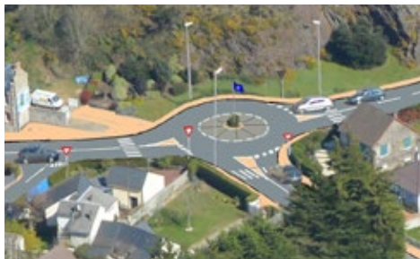
Nous aurions préféré la reprise du projet de rond point

CE QUI FAIT DÉBAT : Le printemps a été le théâtre des réalisations de fin de mandat : aboutis ou pas. Présentés lors de réunions publiques, à peine les micros éteints, les engins commençaient à décaisser confirmant l'hypocrisie d'une concertation qui n'en avait que l'apparence à la grande désillusion de ceux qui avaient fait le déplacement et des commentaires.