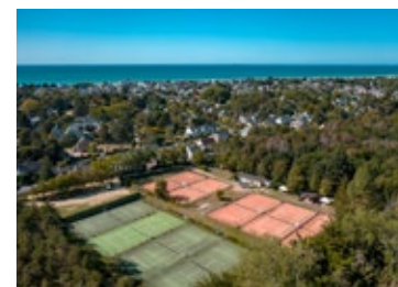
Tennis Club de Jullouville