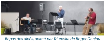
Repas des aînés, animé par Triumvira de Roger Danjou