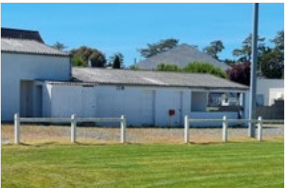
Vestiaires du club de foot

Les parents d'élèves ont été mis devant le fait accompli en apprenant la veille des vacances de février qu'il n'y aurait plus qu'un seul service de restauration le midi à l'Ecole Eric Tabarly. Pourtant tous (personnels, enseignants, parents et enfants) étaient satisfaits du dédoublement de service. La pause méridienne était devenue plus calme et propice au retour au travail. La réorganisation du personnel fragilise aussi l'Accueil de Loisirs qui travaille à flux tendu et sans filet (un seul diplômé habilité à l'accueil). Enfin, le Maire paraît surpris de l'ultimatum posé par la Fédération Française de Football concernant l'état des vestiaires du terrain de Jullouville. Des solutions d'investissements rapides s'imposent. Cette menace est pourtant depuis longtemps légitime ! Il n'est pas difficile dans ce cas de présenter un bilan financier satisfaisant au cours du débat d'orientations budgétaire lorsque l'on ne répond pas aux besoins matériels et humains.