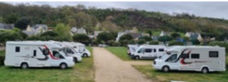
Aire de camping-cars

C'est d'avoir attendu 4 ans pour être efficacement associé au travail réalisé en commission concernant le règlement de l'aire de Camping-car. Nous constatons avec satisfaction que la démarche prouve son efficacité.