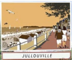
N'est-ce pas plus ressemblant ?