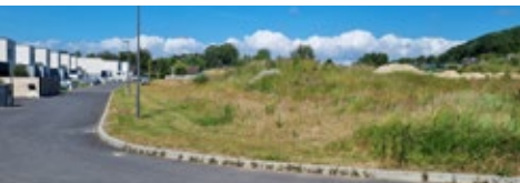
Terrain avenue Lanos Dior