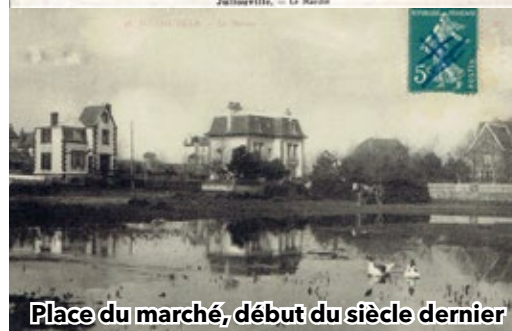
Place du marché, début du siècle dernier