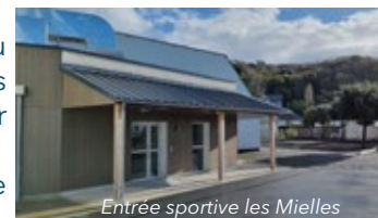
Entrée sportive les Mielles