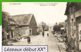
Lézeaux début XX°