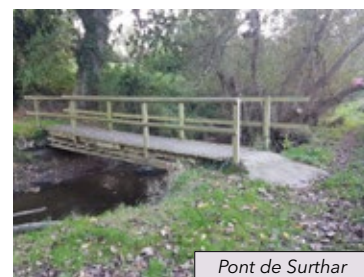
Pont de Surthar

Aujourd'hui, la circulation à Lézeaux venant de Saint-Pierre-Langers par la RD 109, s'est intensifiée, sans oublier les poids lourds sortant de la carrière de Cosnicat. En sécurisant l'arrivée la plus directe sur Jullouville, le nouveau rond-point du Château (de Saint-Pierre-Langers) va en accroître le flux. C'est un sujet d'inquiétude pour les habitants. Les virages du Mesnil-Grimeult sont dépourvus de trottoirs, or les nouvelles constructions sont habitées, pour la plupart à l'année et les enfants rejoignent l'abri bus du bas de Lézeaux. Le Stop du carrefour a déjà sauvé bien des vies mais ne suffit plus tant la circulation venant de Saint-Pair par la RD 21 est dense.