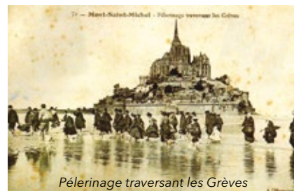
Pèlerinage traversant les Grèves