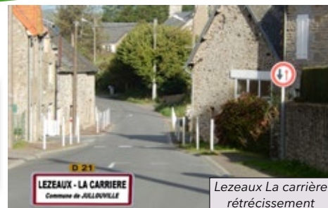
Lezeaux La carrière rétrécissement

L'arrivée sur la commune de Jullouville par l'Est se fait par Lézeaux-La Carrière, un « village rue » à flanc de coteau marqué par un carrefour stratégique en fond de vallée. Sauf à s'échapper vers Saint-Pair via le Pont de Lézeaux, il n'y a plus qu'à monter vers le calvaire de « La Croix » pour découvrir une des plus belles vues sur la côte et la Mare de Bouillon.