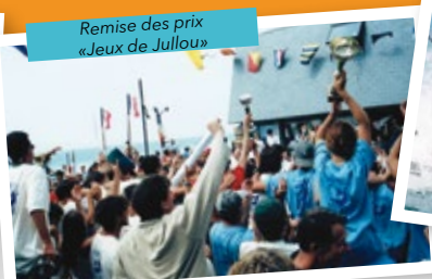
Remise des prix «Jeux de Jullou»