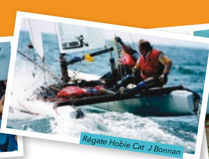
Régate Hobie Cat J Bonnan