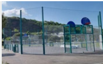
Le city stade

Nous regrettons l'implantation du City stade loin de l'Ecole et du Centre de Loisirs. La rénovation de la place du marché excentre celui-ci et est loin des attentes recensées et de l'étude faite avant 2020 (halle etc.). La suppression des arbres, même remplacés, nous afflige. Les travaux de la Maison Jaune manquent totalement d'ambition. L'expérience de la Salle des Mielles aurait pu faire entendre qu'un bâtiment neuf vaut toutes les rénovations... La future petite salle ne répond pas aux besoins de la capacité d'accueil de l'animation du centre-ville.