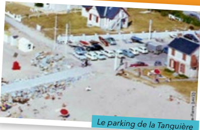
Le parking de la Tanguière

Le club et ses 60 ans, gardent le vent en poupe!